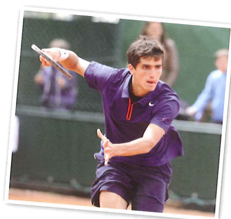
Pierre-Hugues HERBERT, vainqueur à Bressuire et Montauban en 2013

Pour mieux situer la valeur de ces points, il faut savoir que le vainqueur du 1 er tour d'un tournoi du Grand Chelem marque 45 points ATP.